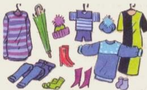
Товары и услуги