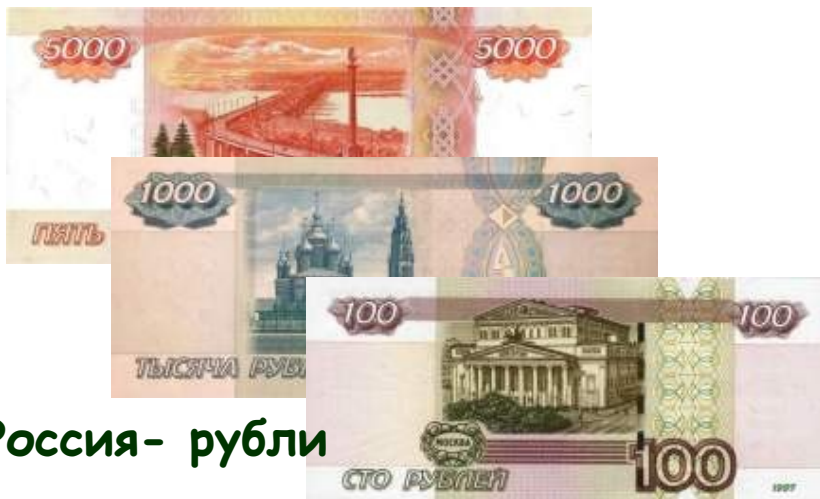
Россия - рубли