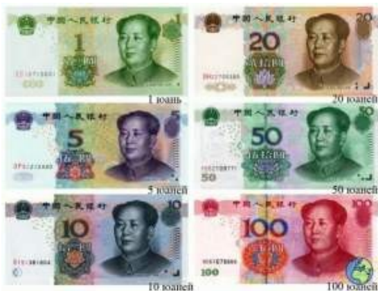
Китай - юань