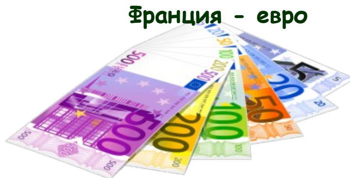
Франция - евро