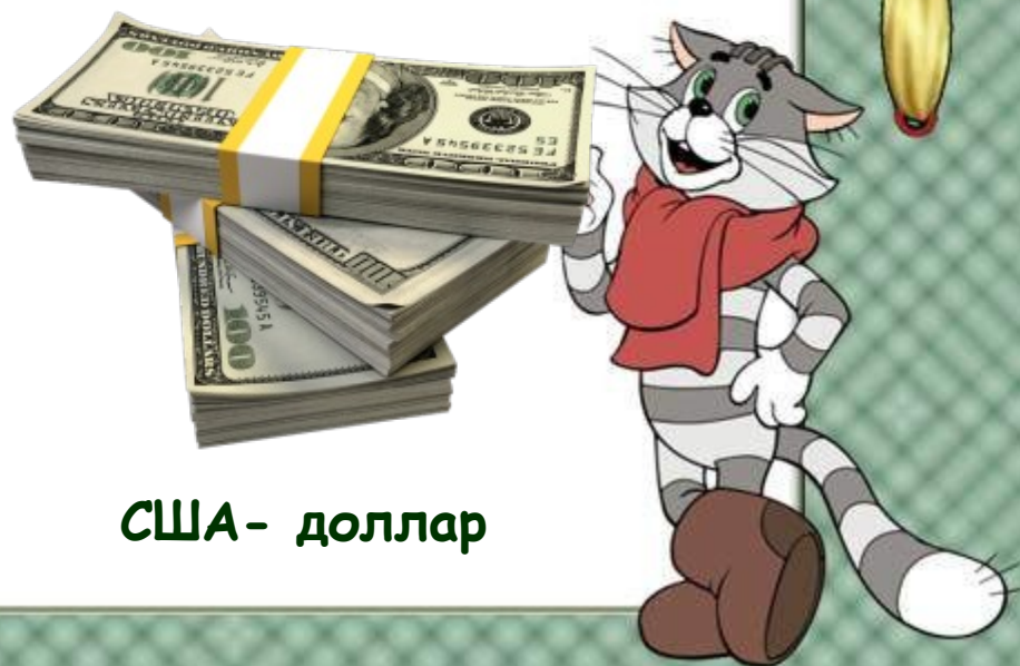
США - доллар